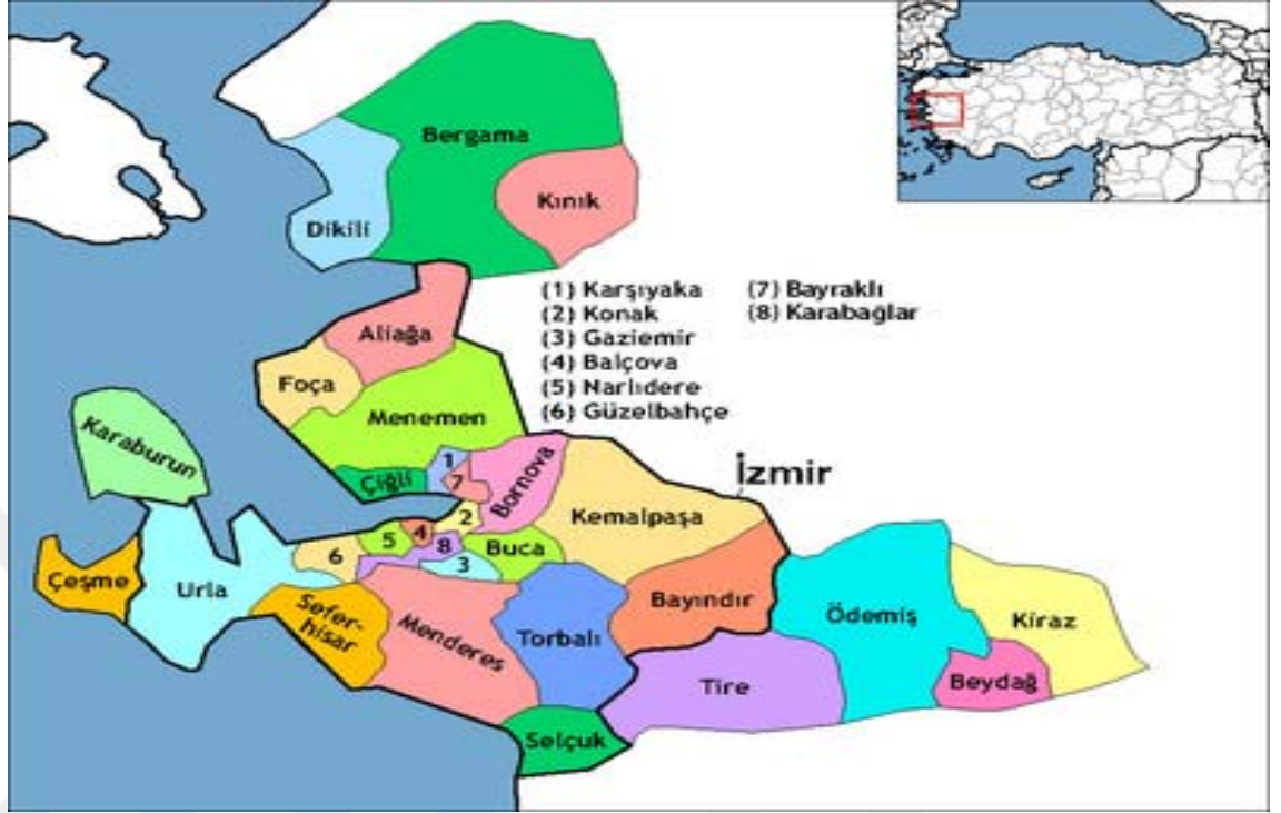
1. İzmir Büyükşehir Belediyesine Bağlı İlçeler