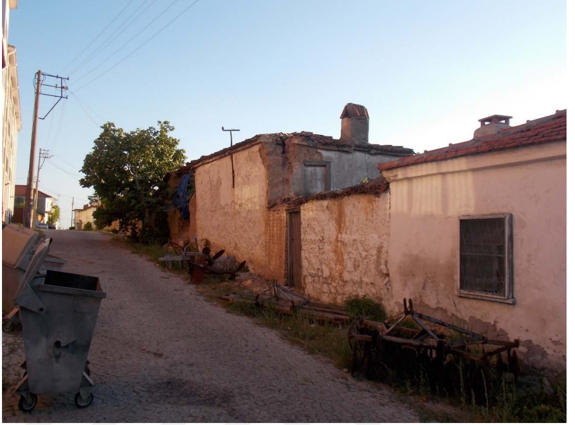
7. Zeytinadağ Mahallesi'nin Bakımsız Yolları ve Harap Evleri