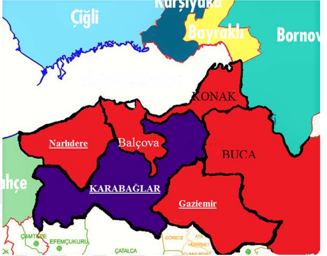
2. Karabağlar İlçe Haritası