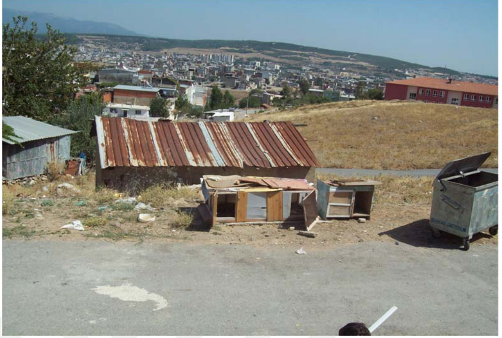
4. Karabağlar İhsan Alyanak Mahallesi