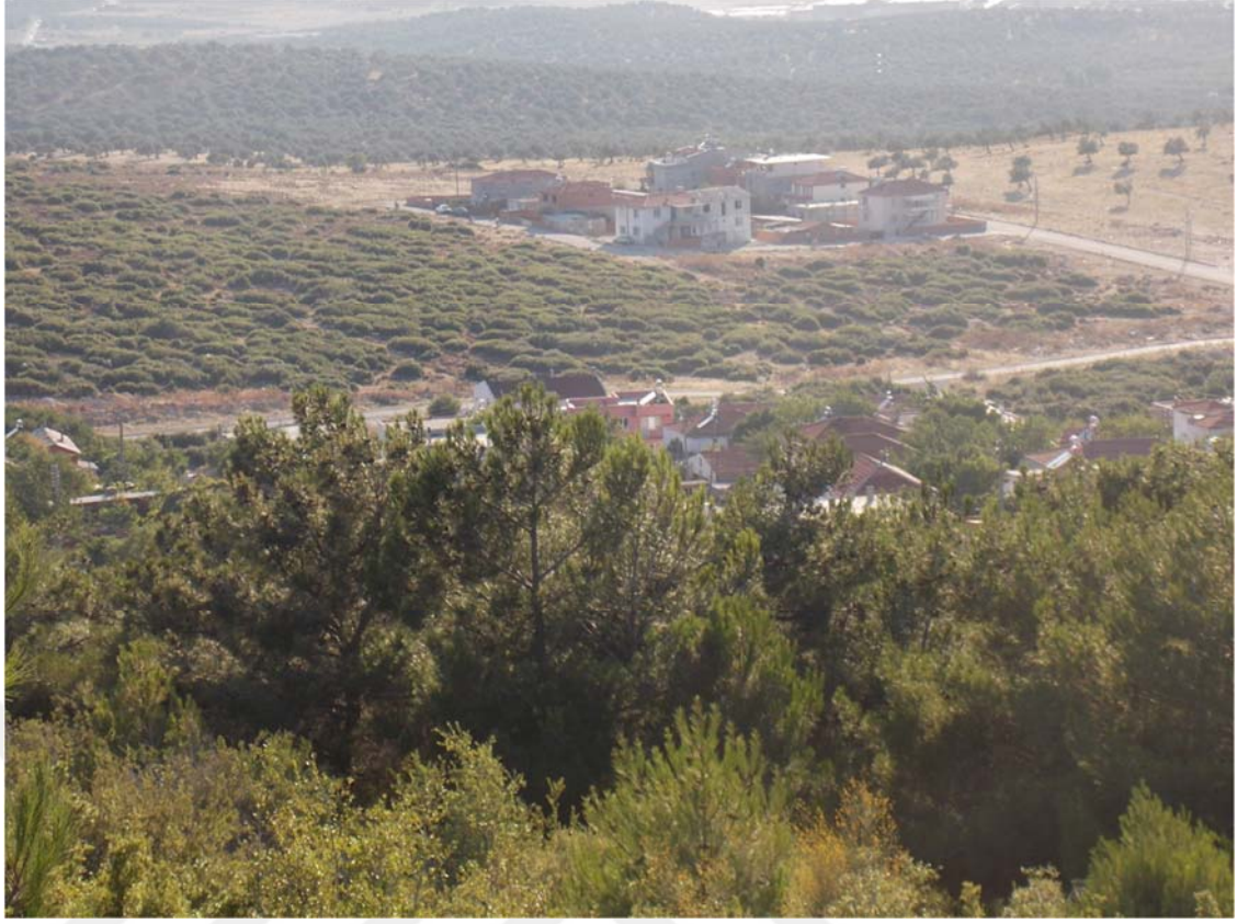
6. Zeytindağ Mahallesinden Etnik Kökene Dayalı Olarak Oluşmuş Bir Yerleşim Alanı