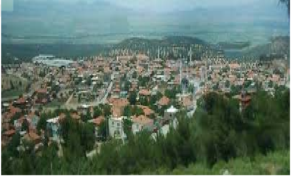
5. Bergama İlçesi Zeytindağ Mahallesine Kuşbakışı