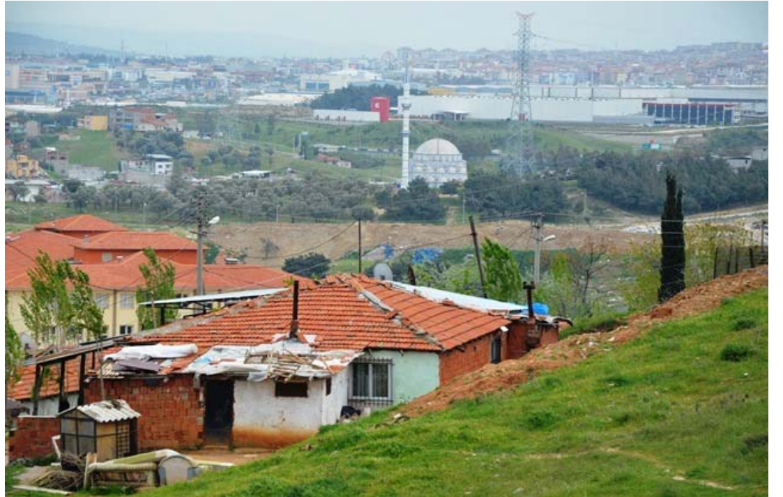
3. Karabağlar İhsan Ayanak Mahallesi